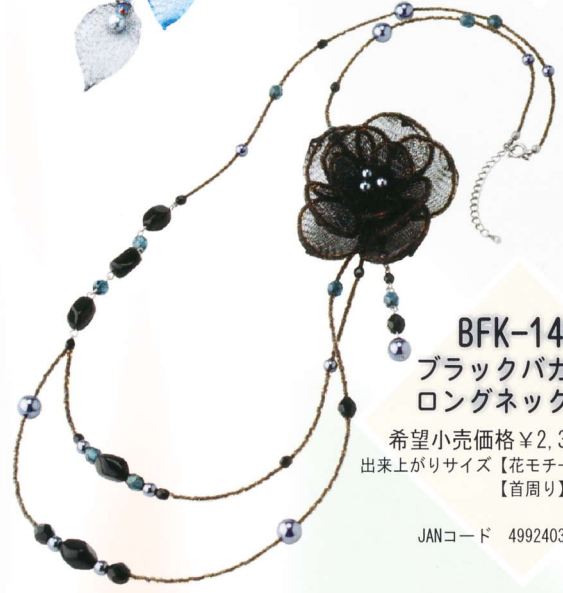
BFK-148 ブラックバカラ・ ロングネックレス

希望小売価格 ¥2,000 (税別) 出来上がりサイズ【首周り】約45~50cm 【ぶら下がり部分】約11cm JANコード 4992403 851272