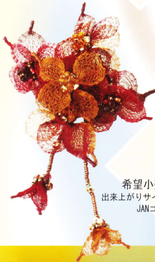
BFK-149 秋色小花 ブローチ

希望小売価格 ¥2,300 (税別) 出来上がりサイズ【花モチーフ】直径約5cm 【首周り】約90~95cm(長い方) 約82~87cm(短い方) JANコード 4992403 851289