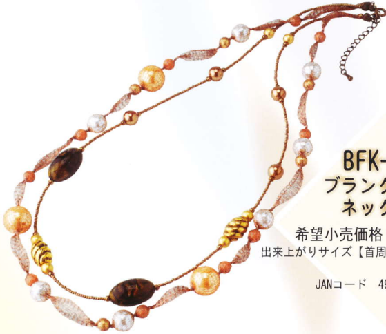
BFK-145 ブランクール・ ネックレス

真鍮と銅を合わせたハリのある繊細な素材は、作品のディテールを自由に表現出来ます。