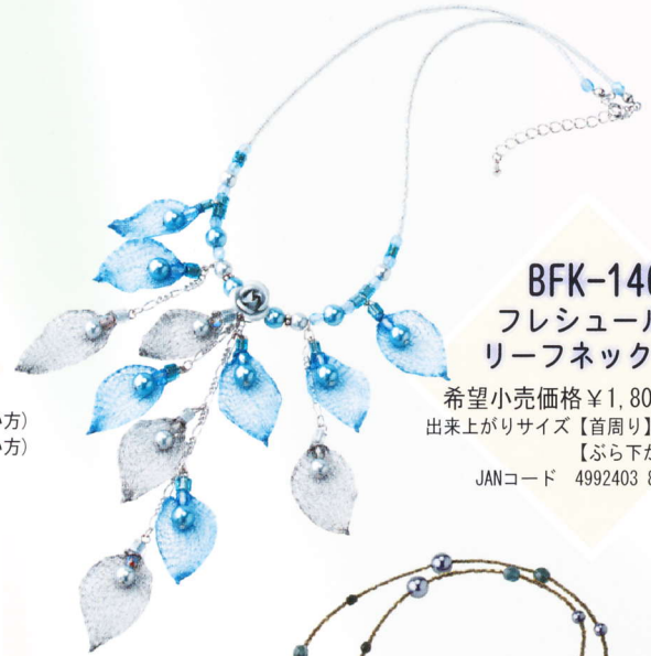
BFK-146 フレッシュル・ リーフネックレス

希望小売価格 ¥1,800 (税別) 出来上がりサイズ【首周り】約65~70cm(長い方) 約59~64cm(短い方) JANコード 4992403 851258