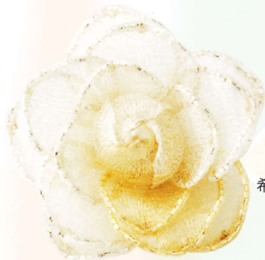
BFK-150 シャイニー・ カメラアブローチ

希望小売価格 ¥1,800 (税別) 出来上がりサイズ約12cm(ぶら下がり部分含む) JANコード 4992403 851296