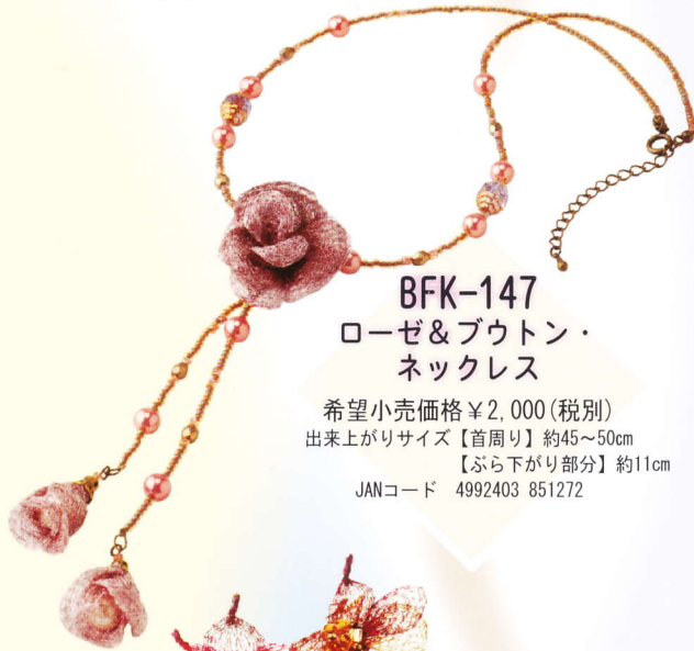
BFK-147 ローゼ&ブトン・ ネックレス

希望小売価格 ¥1,800 (税別) 出来上がりサイズ【首周り】約43~48cm 【ぶら下がり部分】約11cm JANコード 4992403 851265