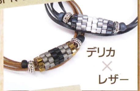
デリカ × レザー