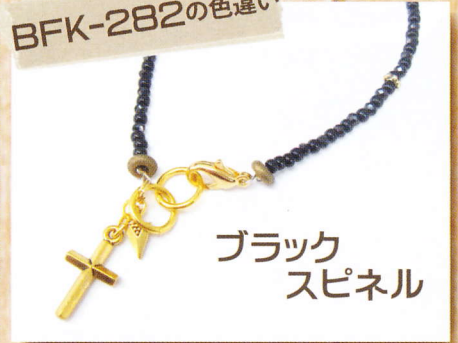
ブラック スピネル