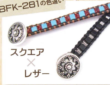
スクエア × レザー