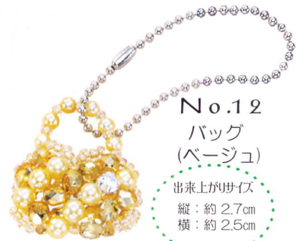
No.12 バッグ (ベージュ)