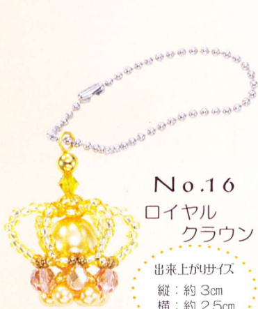
No.16 ロイヤル クラウン