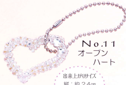
No.11 オープン ハート