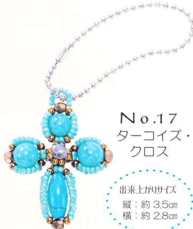
No.17 ターコイズ・ クロス