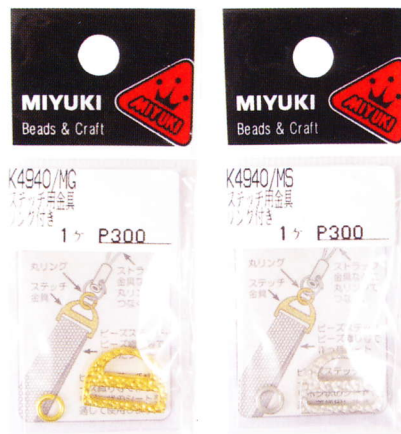
〈パックサイズ〉横：40mm×縦：90mm