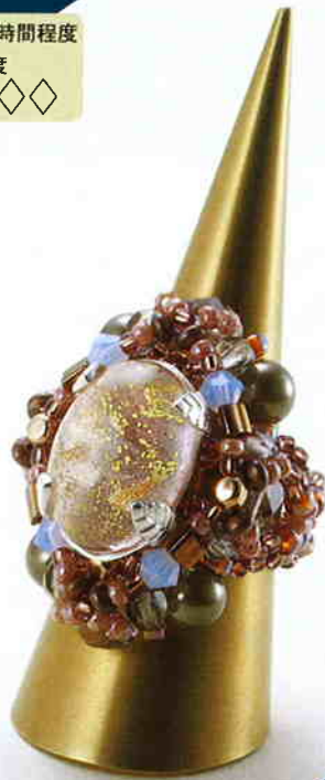
ガラスカボッションの アンティークリング 税込価格1,470円(本体価格1,400円) サイズ：9～13号 4964291-371453