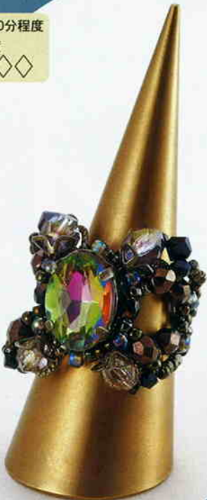
カットビトレールの クロスリング 税込価格1,260円(本体価格1,200円) サイズ：9～13号 4964291-371477