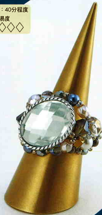
カットガラスの ポイントリング 税込価格1,470円(本体価格1,400円) サイズ：9～13号 4964291-371460