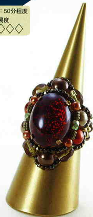
ガラスカボッションの パールリング 税込価格1,470円(本体価格1,400円) サイズ：9～13号 4964291-371484